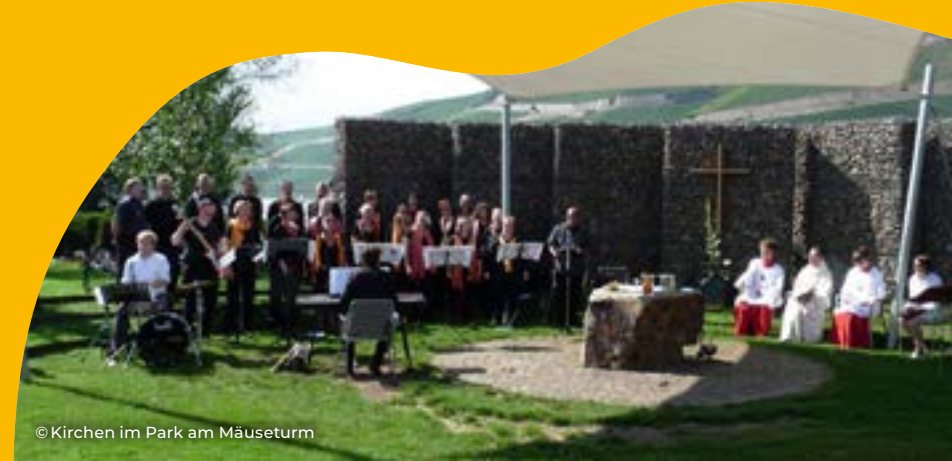
© Kirchen im Park am Mäuseturm